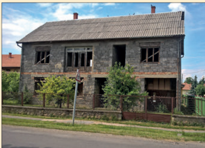
Egy magáningatlan látképe 30 évig a Rákóczi úton, mielőtt az önkormányzat megvásárolta