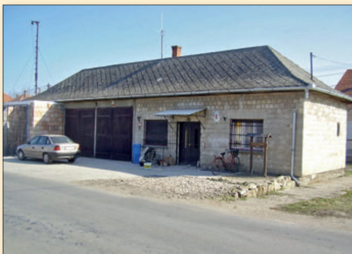
A nagy múltú, ma is a községet vigyázó Jászalsószentgyörgyi Tűzoltó Egyesület szertára régen