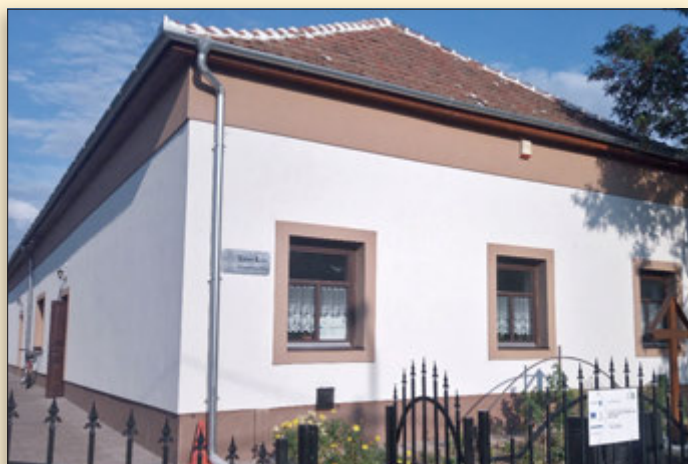
Megmentés és felújítás után, közösségi házként működik tovább