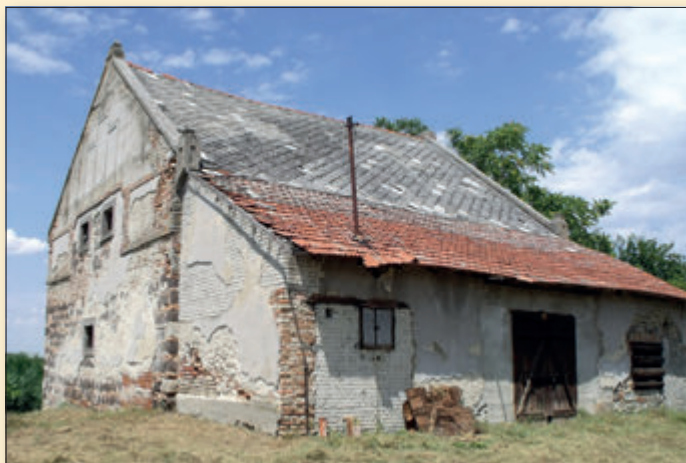
Erzsébet malom, az enyészet martalékában önkormányzati megvásárlás előtt 2009-ben