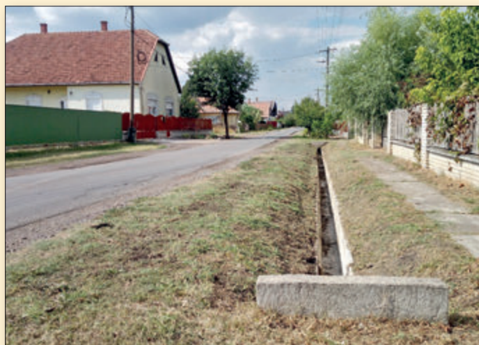
Kiépítésre került korszerű belvízelvezető rendszer, majd a Kölcsey út teljes burkolata megújult