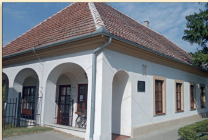
Az épület mai látképe, hagyományaihoz és funkciójához méltó külső-belső felújítás után