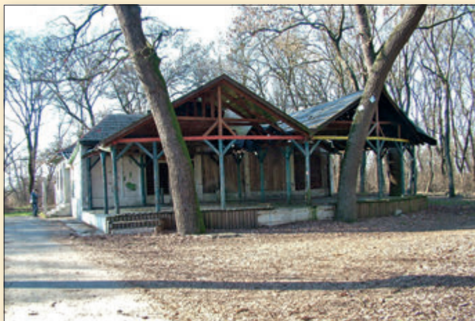
Vadas Vendégház (Csárda) 2007, önkormányzati megvásárlás és felújítás előtt