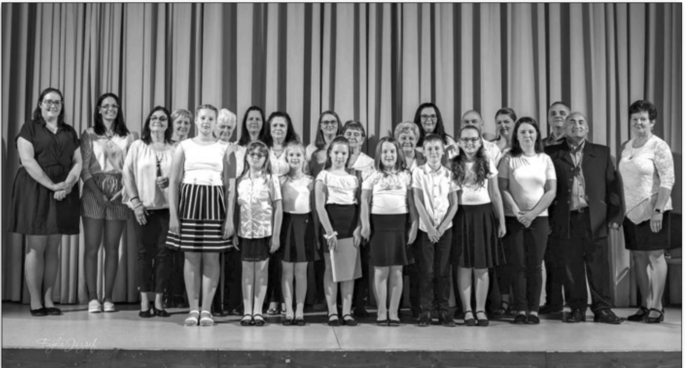
A „Tavaszi szél vizet áraszt” című műsorestünkön készült a kép. Sajnos hiányos, voltak, akik nem tudtak eljönni.