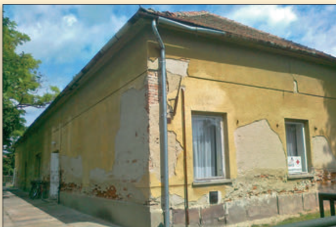
Még egy építészeti és közösségi történelmi értékünk, a 140 éves „Papok iskolája”, a lebontás határára sodródott az elmúlt 60 évben