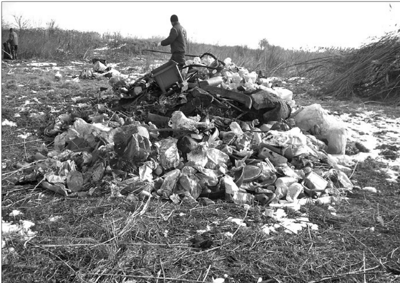
A szemételep (Mirhó) és környéke 2008-ban, felszámolása előtt