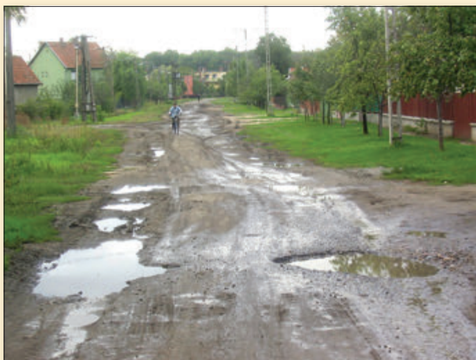
Az egyik legforgalmasabb gyűjtőút, a Vörösmarty látképe 2007-ben