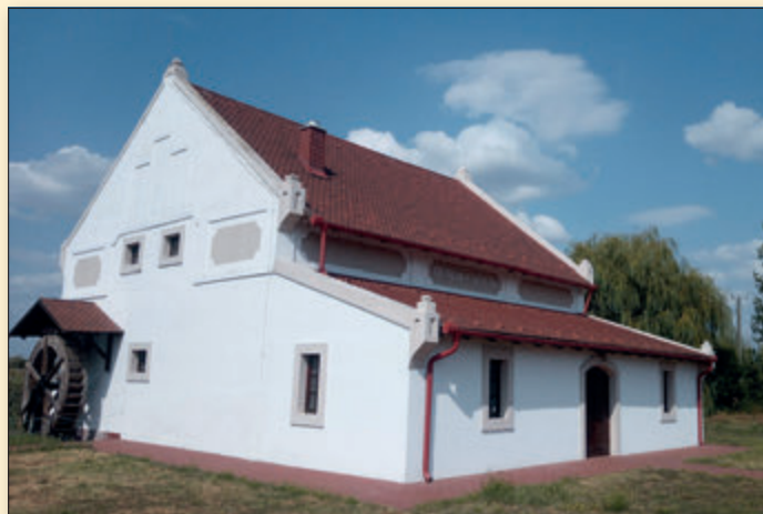
2013 végére elkészült az újjáépítés és a település országos ismertségű értékévé vált