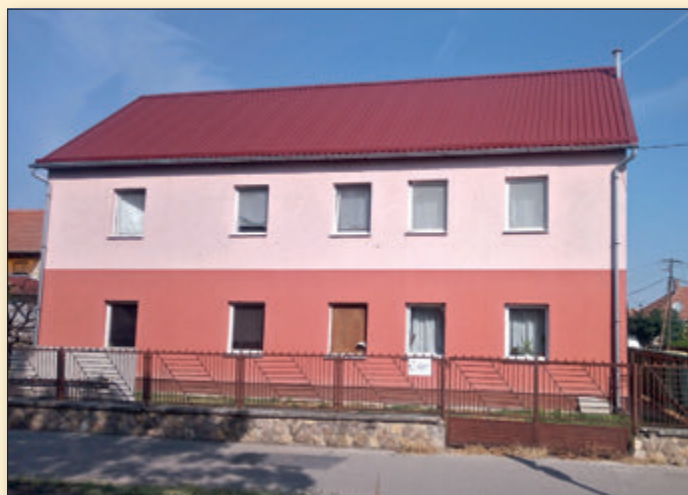
Önkormányzati megvásárlás és fiatal pároknak 4 lakásos „fecskeház” alakítás után, mellette az új kerékpárúttal