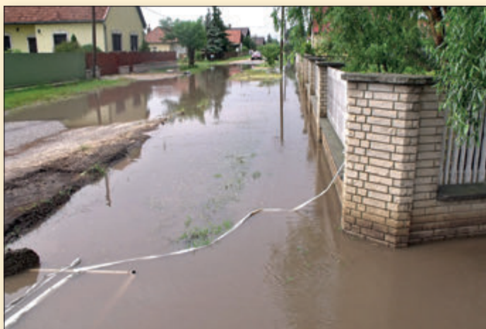
A korábban a település nagy részén nem működő belvízelvezetés egyik hatása látható a Kölcsey úton, egy komolyabb zivatar után