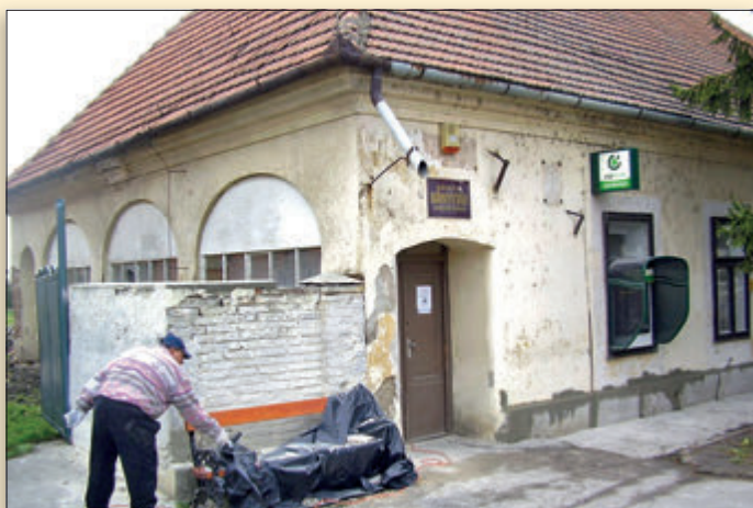
A harmadik legrégebbi épületünk (1836), egykor Község háza, ma Könyvtár felújítás előtt