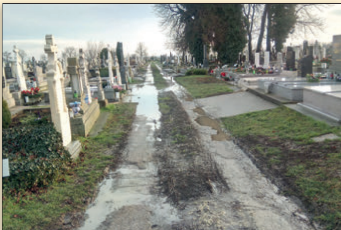
Leromlott, méltatlan állapotú úthálózat a temetőben, melyet sajnos „mindenki használ”