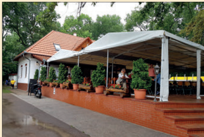
Felújítás után, ahol azóta 500 program, rendezvény került megtartásra