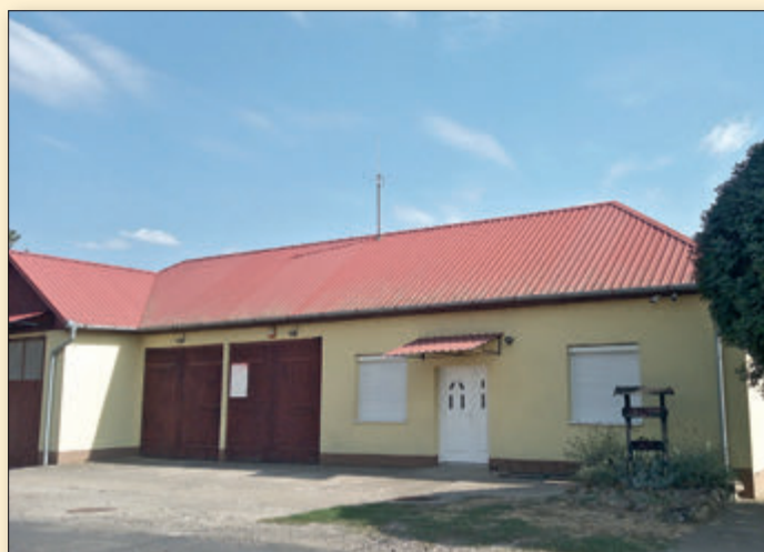
Napjainkban, a helyi tűzoltók és az önkormányzat összefogásával felújítva