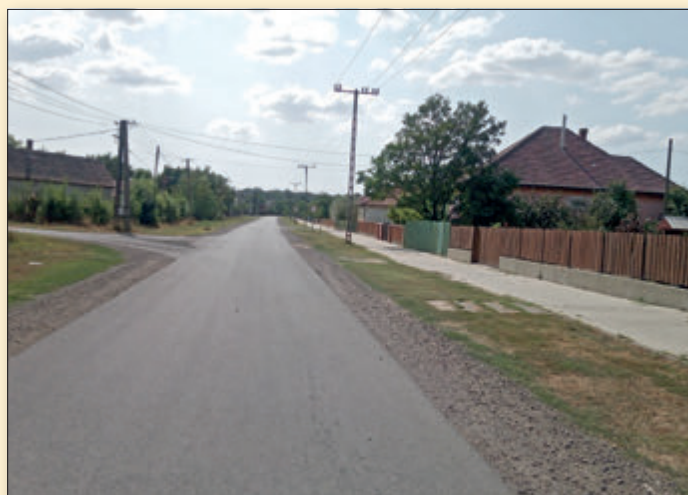
Az 1,3 km hosszon teljesen megújult és szélesített Vörösmarty út, mellette 500 m szakaszon kerékpár- és gyalogút épült, a községben további 21 út újult meg