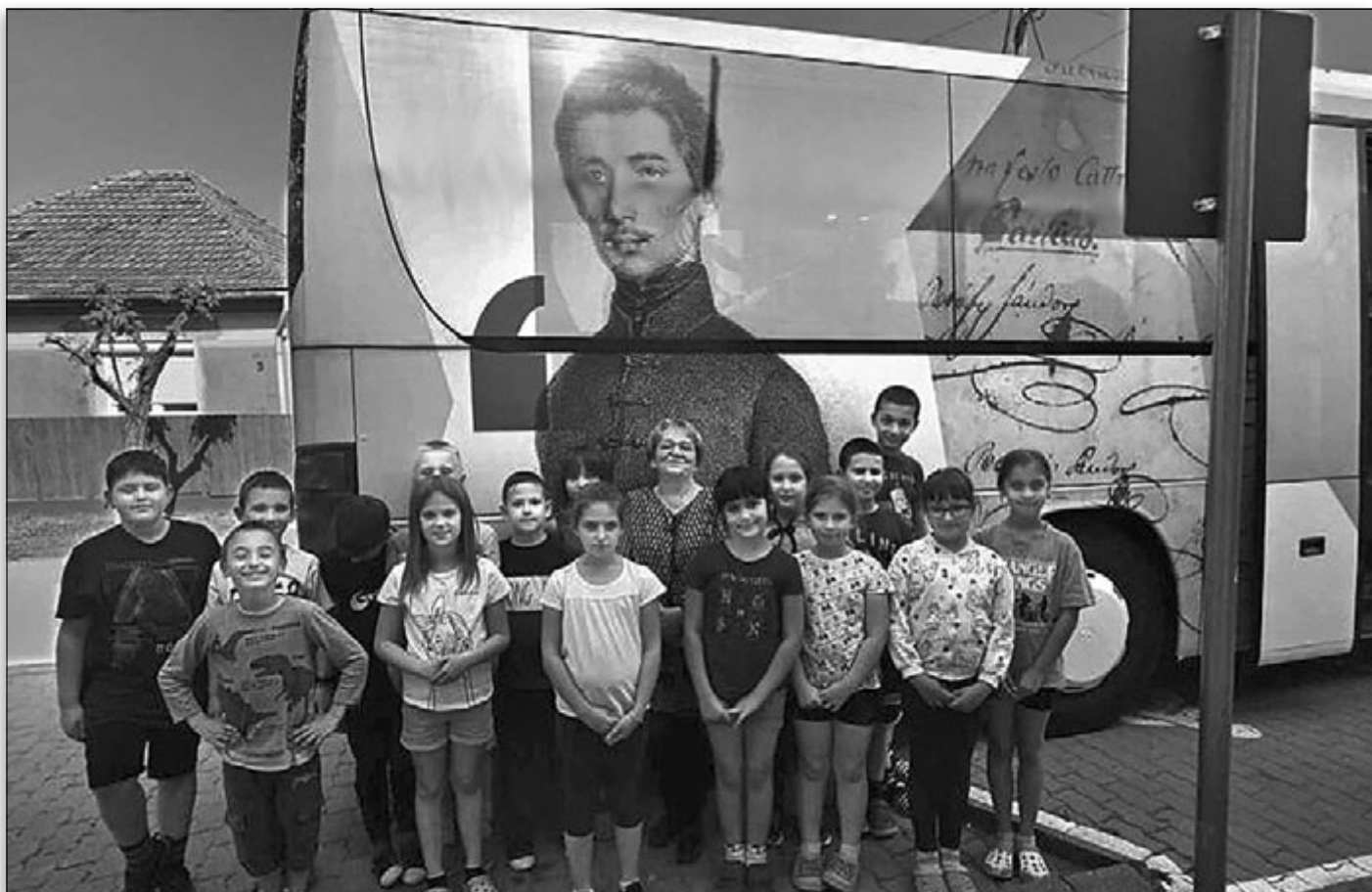
Különleges tárlatot tekinthetek meg tanulóink Petőfi Sándor születésének 200. évfordulója alkalmából.